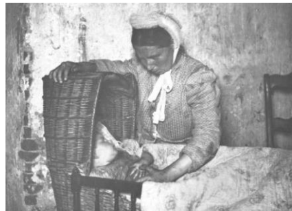
1866-N Gemiddelde leeftijd: 40 jaar.