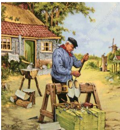
1889R Meer dan tweehonderd klompenmakers in Enter!