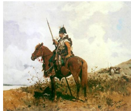
Kozak te paard

1808-R In Utrecht maken Hengelose ondernemers goede sier met producten van hardwerkende, arme Twentse thuiswerkers.