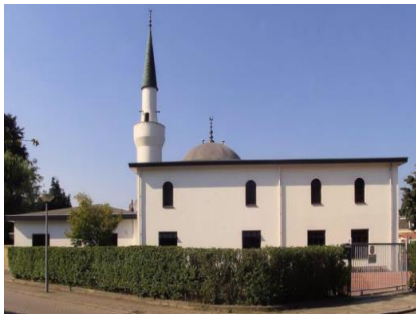
Eerste moskee in Overijssel (Almelo)