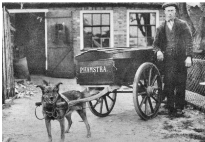
De hondenkar is een gewoon verschijnsel in het straatbeeld