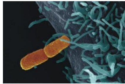
Links op foto: bacterie die 'rode loop' (bloedige diarree) veroorzaakt