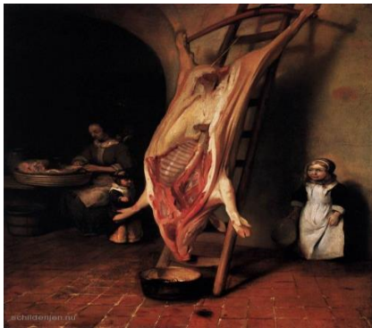
1876-R Je eigen varken...