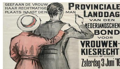
1917-N Eindelijk mag iedereen stemmen.