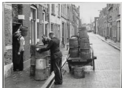
1873-R De 'Boldoetkar'....!