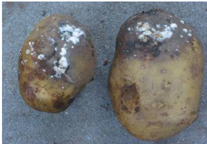
1845-R Oproer in Rijssen en hongersnood in Overijssel.