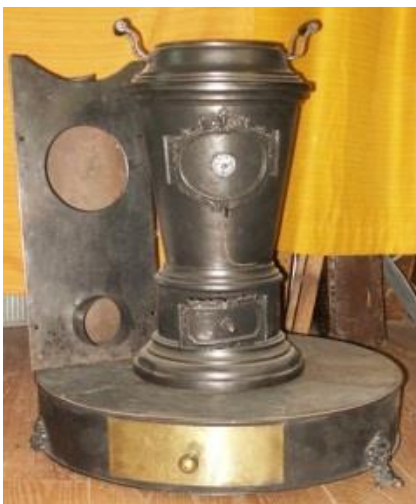
1856-R Open vuur verdwijnt geleidelijk.