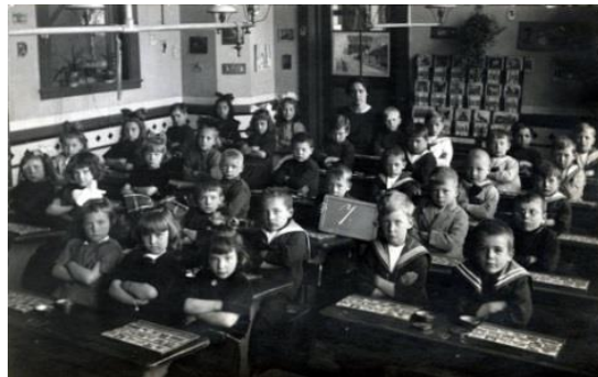
1901-N Alle kinderen naar school