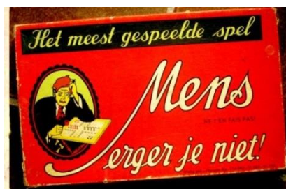
1920-R/N Introductie van het consultatiebureau en een nieuw bordspel.