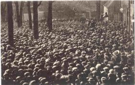
1891-R Staken in Twente is afzien.