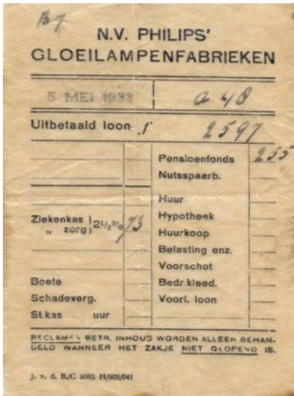
Werknemers krijgen elke week een loonzakje