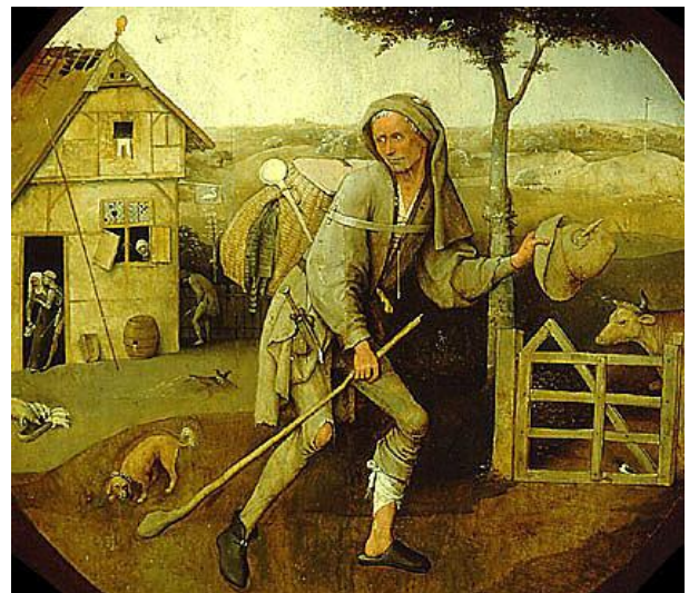
Marskramer (Jheronimus Bosch, ca. 1494)

Wel is er dit jaar al sprake van een kredietcrisis...!!! (zie 1763-N )