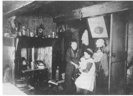
1860-R De eerste sociale woningbouw.