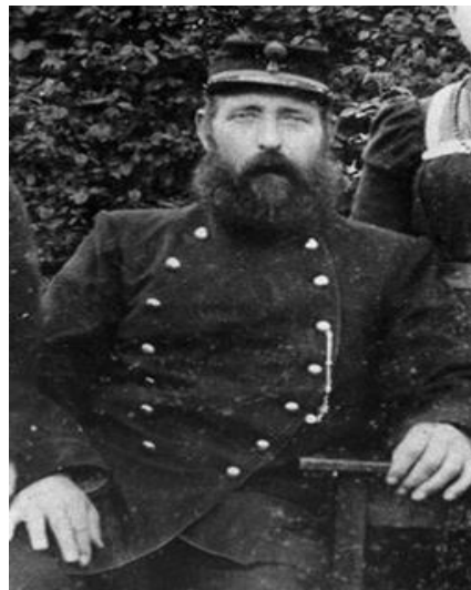
1871-R Je eigen straatje schoonvegen: de veldwachter ziet er op toe dat het gebeurt.