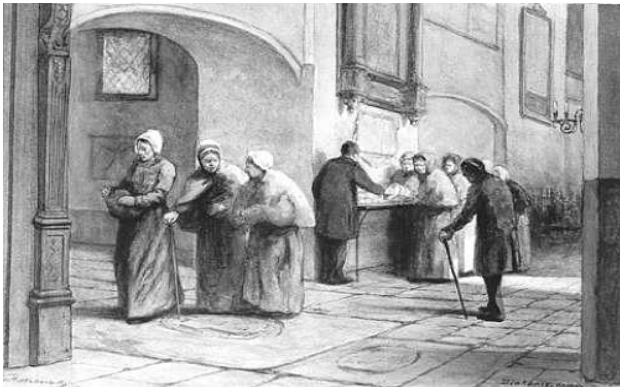
Brooduitdeling in een kerk